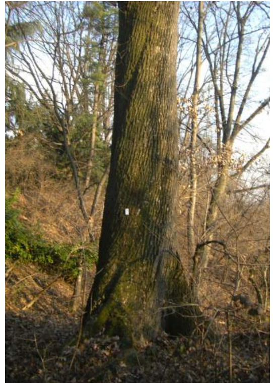
La farnia: l'albero più grande del Parco e probabilmente il più vetusto

L'albero più grande del Parco è una farnia localizzata in bosco sulla riva destra del Borgo Castello. La sua circonferenza di 5,2 m ne fa un esemplare imponente: per abbracciarlo alla base sono necessarie 5-6 persone. E' stato il primo albero del Parco ad essere censito come monumentale (compare già negli elenchi del Corpo Forestale del 1982). L'età stimata potrebbe aggirarsi tra i 300 e i 400 anni. Rappresenta quindi anche una memoria storica imprescindibile avendo vissuto ed osservato il susseguirsi degli eventi degli ultimi secoli di storia del nostro territorio. La pianta doveva già esistere quando i Savoia cedettero il passo ai francesi di Napoleone a cavallo tra il XVIII e il XIX secolo. Gli occupanti dimostrarono poco interesse per i boschi della zona (vedi collana quaderni scientifici n. 5 "Vegetazione e ambienti del Parco La Mandria"), ma l'esemplare riuscì fortunatamente a sopravvivere. Poi, con particolare attenzione, dovette assistere alla costruzione del muro di cinta che ancora oggi possiamo ammirare e che trasformò La Mandria in una riserva di Caccia di re Vittorio Emanuele II. Già annosa assistette infine alla creazione dell'area protetta regionale nell'ormai lontano 1978.