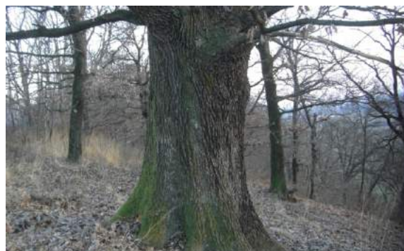
Il suo tronco con una circonferenza di 4m domina nel bosco