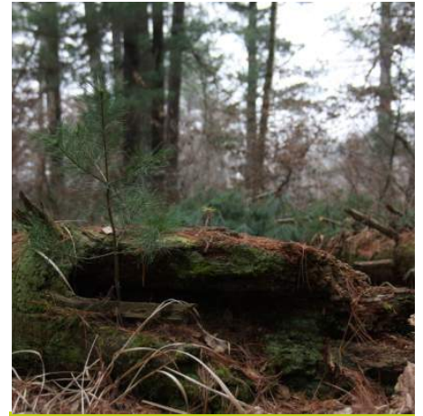
I grossi tronchi di alberi caduti a terra favorisco la rinnovazione delle foreste di conifere

da lasciare all'invecchiamento a tempo indeterminato.