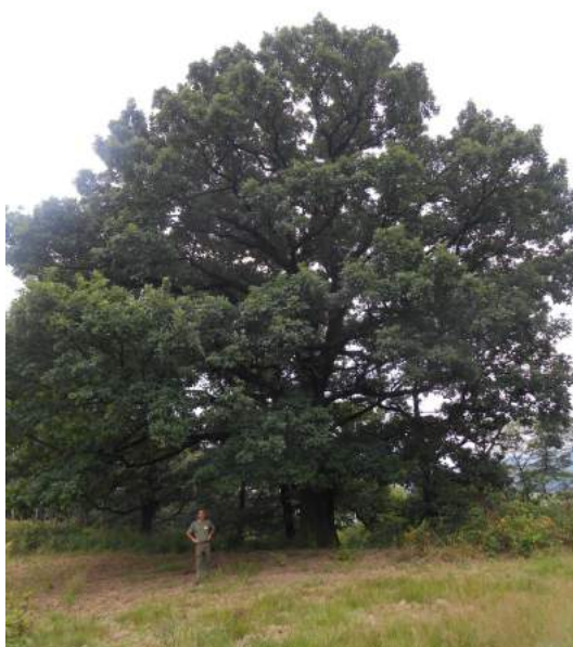
La pianta al margine del terrazzo superiore