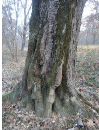
Tronco del ciliegio con una circonferenza di 3,10 m