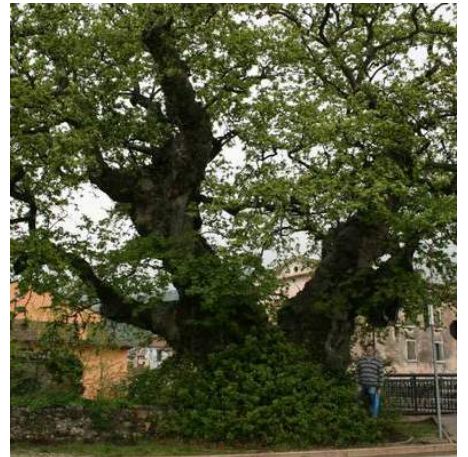
Gli alberi monumentali si localizzano anche in contesti urbani quali orti botanici, strade, piazze e filari alberati, ma il loro ruolo di custodi di diversità genetica, biologica ed ecologica, è sempre molto importante. Ciò è correlato anche alle dimensioni, all'età e alle condizioni vegetative