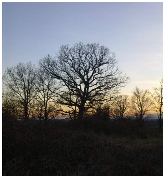
La sua silhouette imponente si staglia nel cielo al tramonto