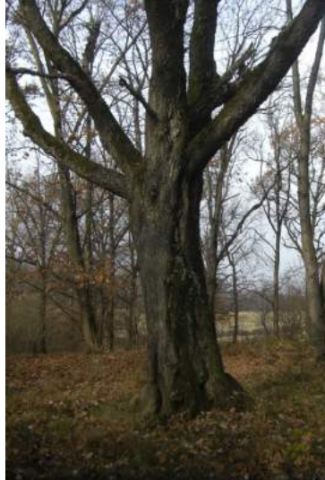
Il ciliegio domina all'interno della foresta

Il ciliegio è una specie molto comune nei boschi sia di pianura che montani, senza mai formare popolamenti puri. E' specie indigena in Europa (in passato se ne dubitava). Resiste molto bene alle temperature minime invernali (- 25° C). Può arrivare ad altitudini di 1500-1700 m, mentre alle quote più basse può soffrire per estati calde, oramai sempre più frequenti. Evita i terreni inondati e quelli eccessivamente argillosi. A 60-80 anni l'albero manifesta già patologie da carie del legno (funghi). Molto esigente di luce e con buona emissioni di polloni radicali, si comporta bene come pianta pioniera nelle aree più aperte o ai margini dei boschi. E' ampiamente distribuito su tutta la pianura ad esclusione della Sicilia.