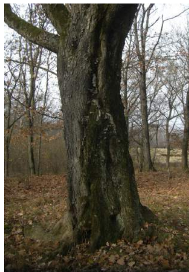
Il ciliegio è stato dichiarato monumentale per età e dimensioni

Il ciliegio delle Lanche Ferloch, anch’esso ubicato in un’area interdotta al pubblico, si colloca all’interno di un bosco misto di querce autoctone e querce rosse (americane). La densa copertura forestale attorno ha probabilmente contribuito ad indebolire i rami posti in alto nella chioma con una inevitabile auto potatura degli stessi. La caratteristica principale sono le sue dimensioni: il ciliegio, come specie, non è un albero longevo, non supera quasi mai i 100-150 anni e quindi raramente assume dimensioni notevoli. Il nostro ciliegio invece è sopravvissuto alle continue ceduzioni del bosco intorno e quando ci si avvicina a pochi metri si presenta imponente rispetto alle piante vicine.