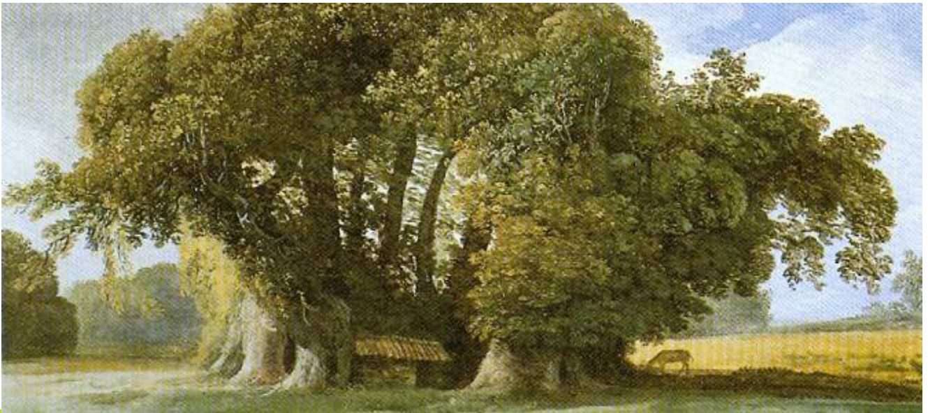
Il castagno dei cento cavalli, (opera di Jean-Pierre Houël ca. 1777), nel Parco dell'Etna, custodisce una memoria storica legata a vicende che si confondono tra realtà e leggenda

Gli alberi monumentali sono vegetali isolati o facenti parte di formazioni boschive naturali o artificiali, che possano essere considerati come rari esempi di maestosità e longevità, per età o dimensioni, o di particolare pregio naturalistico, per rarità botanica e peculiarità della specie, ovvero che rechino un preciso riferimento ad eventi o memorie rilevanti dal punto di vista storico, culturale, documentario o delle tradizioni locali. Tali alberi possono essere ubicati in contesti architettonici particolari come ville, monasteri, orti botanici. Sono presi in considerazione anche i filari e le alberate di particolare pregio paesaggistico, monumentale, storico e culturale, ivi compresi quelli inseriti nei centri urbani. Le piante possono appartenere a specie autoctone (originarie del luogo) o alloctone (provenienti da altri contesti geografici).