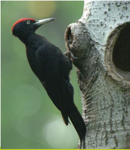
Foro di nidificazione in Mandria del picchio nero su pioppo

Le cortecce di grossi alberi con le loro fessurazioni, con il microclima particolare che si origina all'interno degli interstizi e con il chimismo diverso a seconda delle specie, ospitano importanti comunità di muschi e licheni. Tappeti muscinali estesi possono intercettare l'acqua piovana contribuendo a regolare i flussi idrici in foresta e a formare substrati idonei per la rinnovazione forestale. La varietà di briofite in queste comunità è notevole: su un tronco marcescente di ontano sono stati rilevati muschi appartenenti a 9 diverse specie.